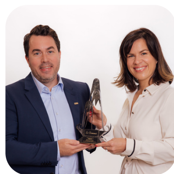
SOMMET INNOVATION RÉGITEX