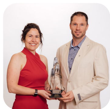
SOMMET ENTREPRISE DE L'ANNÉE SAFARI CONDO