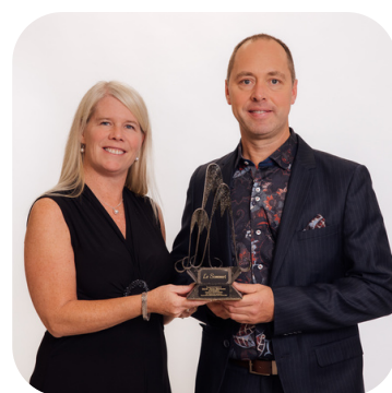
SOMMET ACTIF HUMAIN DLM VOTRE FABRICANT D'ARMOIRES