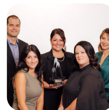
SOMMET NOUVELLE ENTREPRISE LES COMPLICES DU 1070