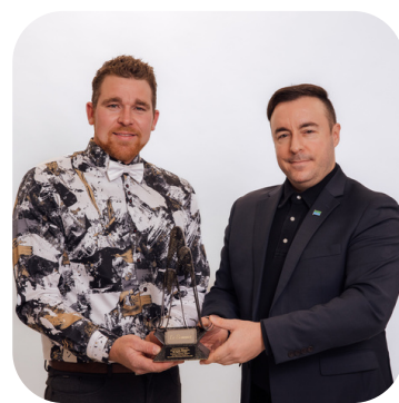
SOMMET VRAIMENT BEAUCE LES FESTIVITÉS WESTERN DE SAINT-VICTOR